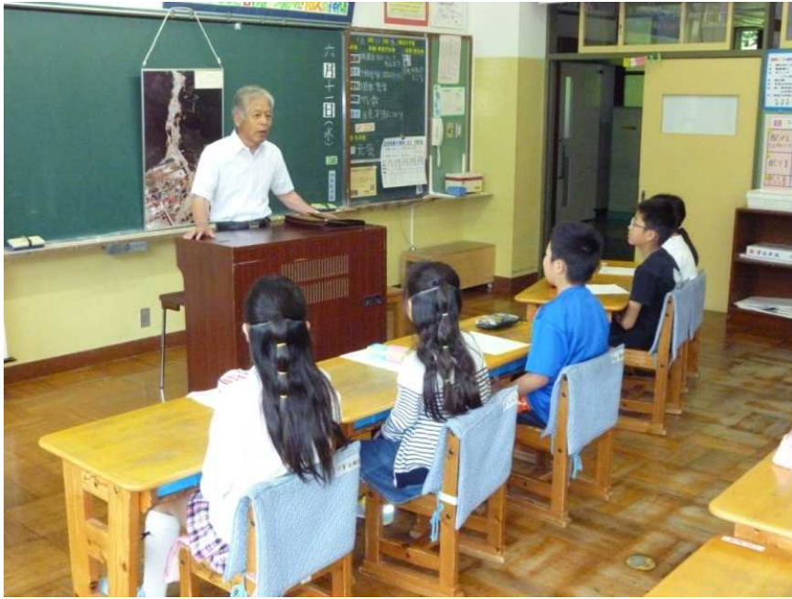
▲地元の人からS54洞谷災害の被災体験について 講義を受ける児童(栃尾小学校)